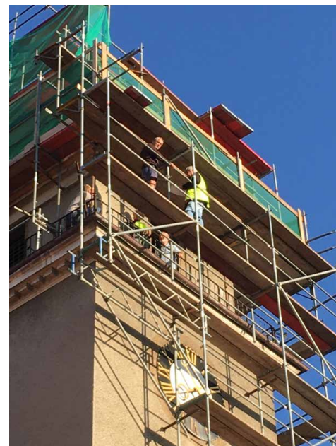
Kontrolní dny stavby probíhají každou středu.

Podle zápisu Evy Palové Dostálové pro Posla připravila Adéla Gabrielová