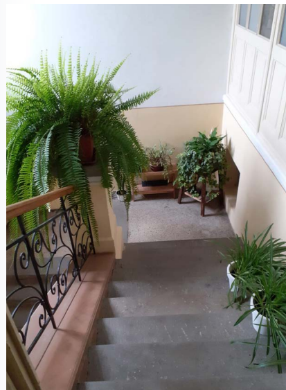
Někomu se prostě kytky daří, a paní farářka na to jednoznačně buňky má. Kytek je plná nejen rozlehlá fara...