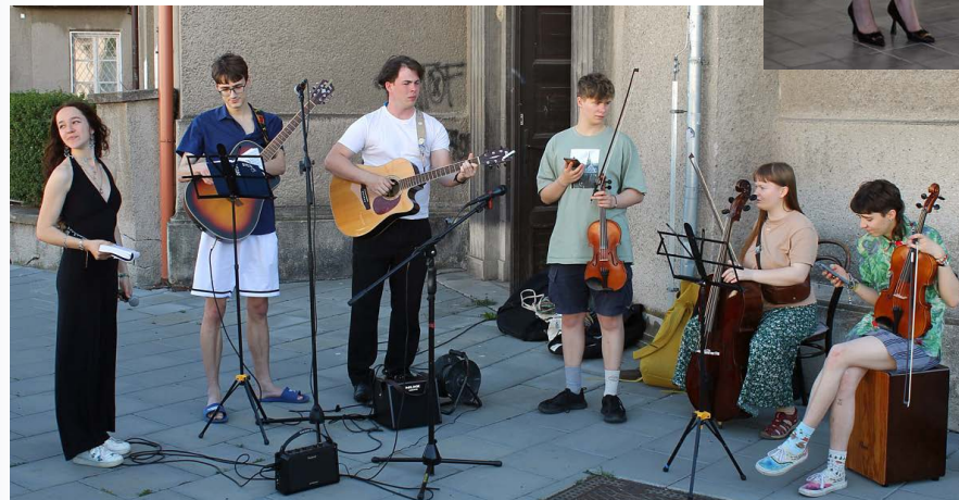
Před kostelem/za kostelem pohodové jamovali mládežníci