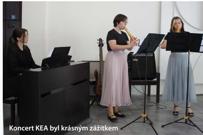
Koncert KEA byl krásným zážitkem