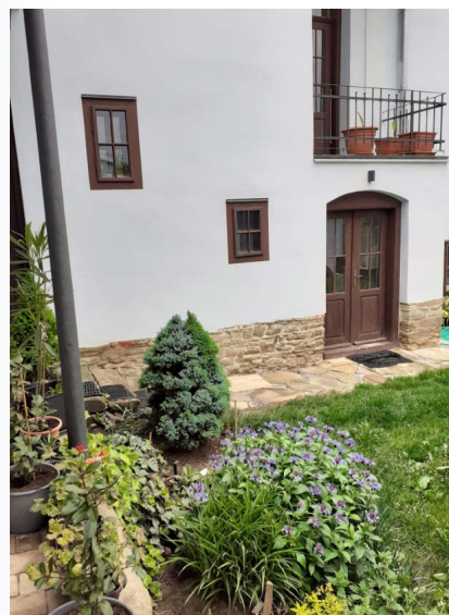
...ale i dvoreček.

ranou, která ho zdecimovala – většina členů totiž byla německé národnosti. Dnes se aktivní členové počítají nikoli na tisíce, ale spíše na desítky. O to působivější však je jejich živá víra a osobní nasazení. Žasli jsme, jaké všechny projekty je sbor schopen udržovat, jak velkoryse opravil faru, jak postupně revitalizuje místní hřbitov, který odkoupil, jak se stará o své budovy, o unikátní knihovnu v kostele, jak vytváří prostředí přizpůsobené pro nevidomé, a dalo by se pokračovat. Za vším je ovšem cítit nezkrotná energie paní farářky, která se ani chvilku nezastaví... Loučili jsme se opět v dešti, s příslibem návštěvy Slováků v Olomouci v blízké budoucnosti a s doufáním, že čtyřhodinová cesta autem nebude zásadní překážkou opakovaných setkání.