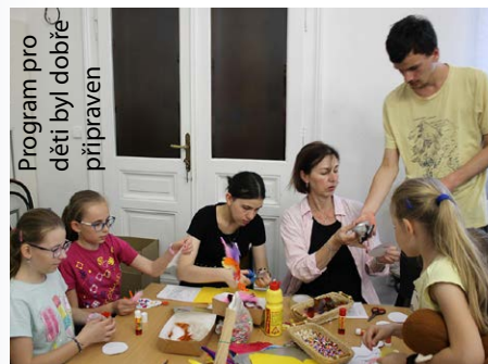
Program pro děti byl dobře připraven